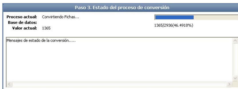
Figura 2.2. Barra de progreso del paso 3 del proceso de conversión.

El paso 3 muestra el estado del proceso de conversión y dependiendo de la cantidad de información (tamaño de la base de datos) el proceso pudiera tardar desde unos minutos hasta varias horas. Al finalizar se mostrará el mensaje “la conversión ha finalizado con éxito”. Ver figura 2.2.