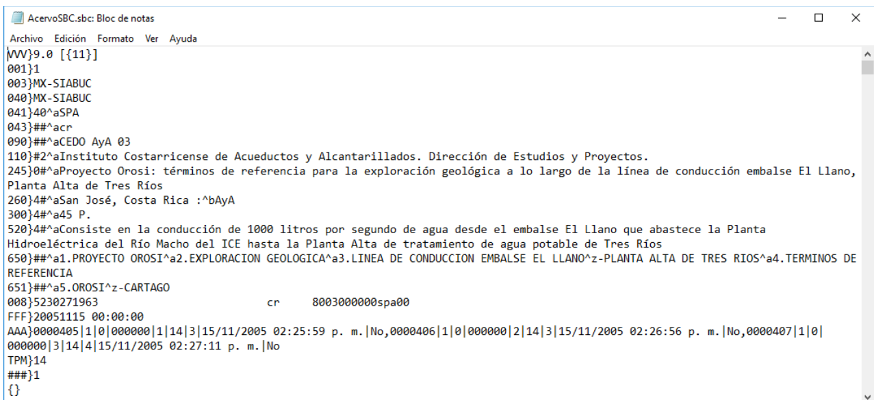
Ilustración 7. Archivo con fichas SBC desde un editor de texto (Bloc de notas)