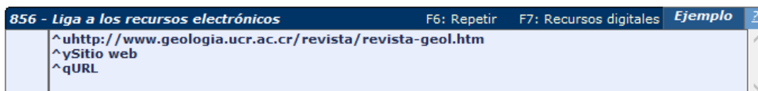
Ilustración 5. Etiqueta 856 con recurso digital asociado