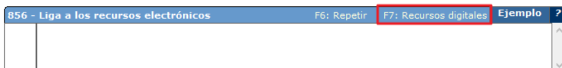
Ilustración 2. Opción para ver el asistente de captura de la etiqueta 856